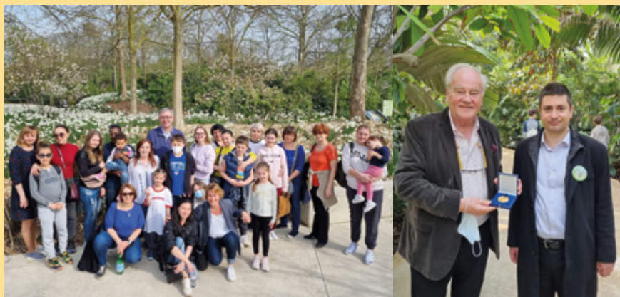
Journée inoubliable de découverte du Parc Zoologique de Paris pour les familles ukrainiennes accueillies à Saint-Maurice.

municipal du 30 mars une délibération visant à soutenir financièrement Emmaüs à hauteur de 5 000 euros. Nous allons également remettre 5 000 euros à la plateforme gouvernementale et 500 euros à Reporters sans frontières ».