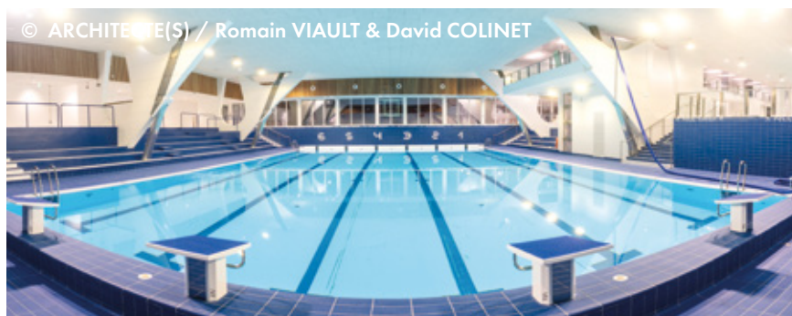
© ARCHITECTE(S) / Romain VIAULT & David COLINET