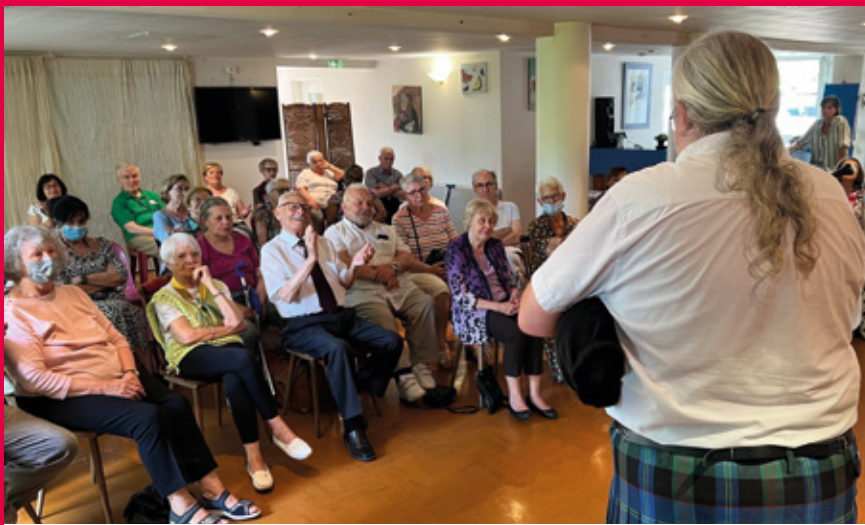
Un joueur de cornemuse a donné le la à la Résidence de Presles.

Relancée en 2021 à Saint-Maurice à l'initiative de la municipalité, la fête de la musique a pris un remarquable essor avec des lieux et des partenaires multiples, un bel engagement des enseignants du conservatoire et une grande mobilisation des services de la Ville. Il y en avait pour tous les âges, tous les goûts, de quoi joyeusement enchanter nos « feuilles de chou ». Un programme varié et hétéroclite afin de renouer avec cette tradition marquant l'arrivée de l'été ! Les Mauritiens étaient ravis de pouvoir enfin se retrouver dans une telle ambiance.