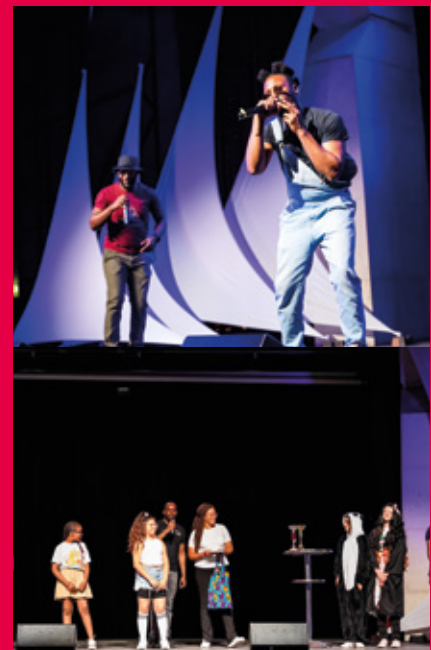
Soirée « Jeunes talents mauritiens » à l'Espace Delacroix.