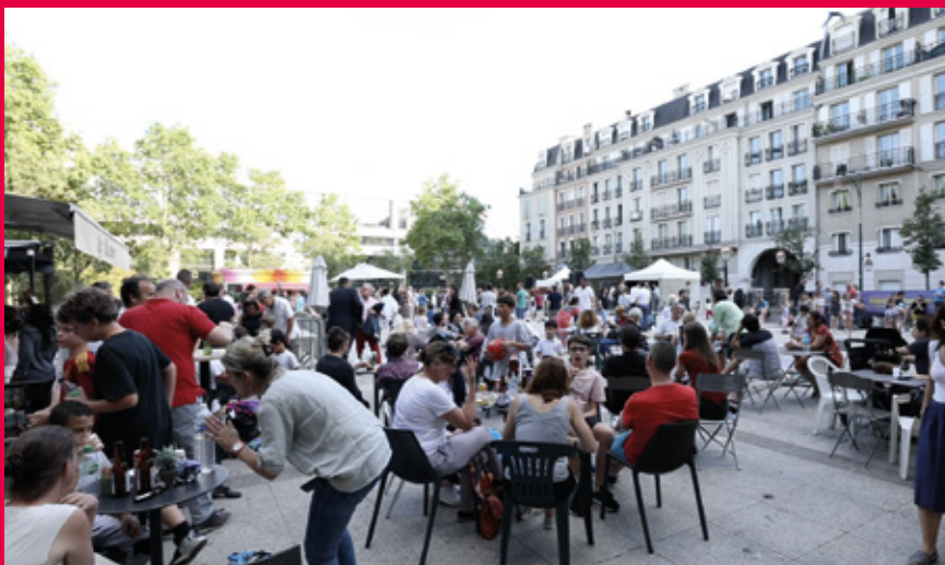
Scène ouverte à la place Montgolfier.