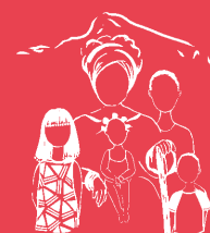
Les enfants de Nimba

Pour parrainer un enfant, une classe ou faire un don : ankasina.org