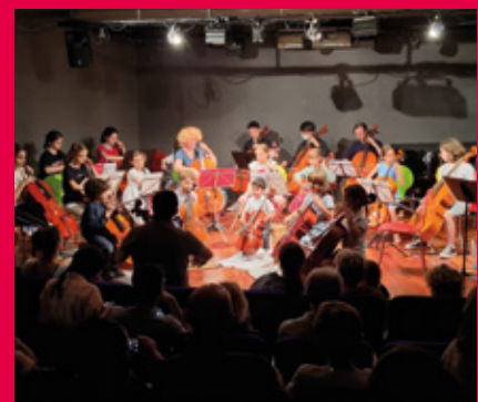
Au conservatoire Olivier Messiaen.