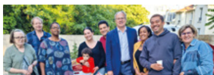
Saint-Maurice du Valais.