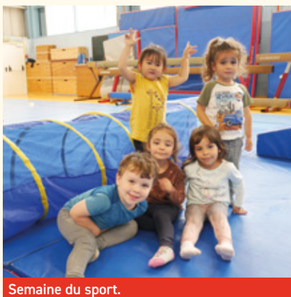
Semaine du sport.