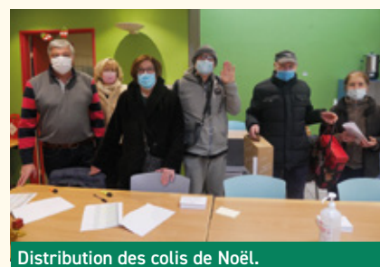
Distribution des colis de Noël.