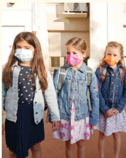
Rentrée scolaire 2021.