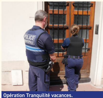
Opération Tranquilité vacances.