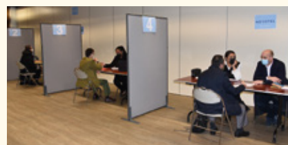
Forum pour l'emploi.