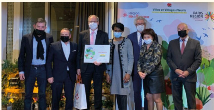
3 fleurs pour Saint-Maurice.