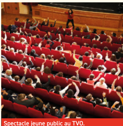
Spectacle jeune public au TVO.