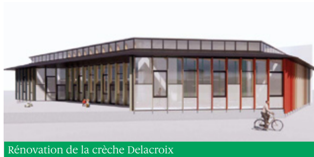
Rénovation de la crèche Delacroix

L'option retenue est donc, pour 2023, de faire appel à une partie des réserves réalisées au cours des dernières années (environ 5 millions €) plutôt que de faire peser l'effort sur les contribuables et les usagers. Rien ne permet aujourd'hui de dire si ce maintien de la pression fiscale sera encore possible en 2024 : tout dépendra de l'évolution de la crise énergétique et du ralentissement de l'inflation.