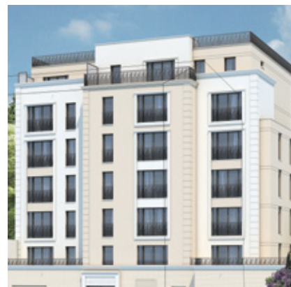
Construction à l'arrière du bâtiment existant.

Immobilière 3F gère 250 000 logements. Son agence, située à Alfortville, assure la gestion de plus de 21 000 logements dans 40 des 47 communes du Val-de-Marne, dont 559 à Saint-Maurice (10 résidences et 5 gardiens). Le cabinet d'architecture 3AM+ et l'entreprise générale de travaux KS CONSTRUCTION ont été sélectionnés pour mener à bien cette opération.