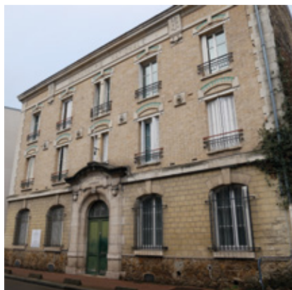
Conservation de l'ancienne gendarmerie.

Immobilière 3F a acquis auprès de la Ville une parcelle située au 85 bis rue du Maréchal Leclerc en vue d'y construire 22 logements. Sur cette parcelle, se dresse l'ancienne gendarmerie qui sera entièrement conservée et fera l'objet de travaux d'entretien et de reprises ponctuelles.