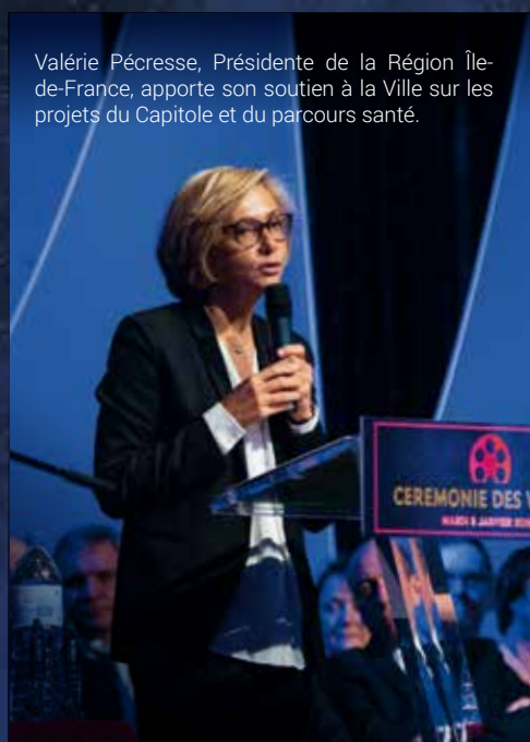
Valérie Pécresse, Présidente de la Région Île-de-France, apporte son soutien à la Ville sur les projets du Capitole et du parcours santé.