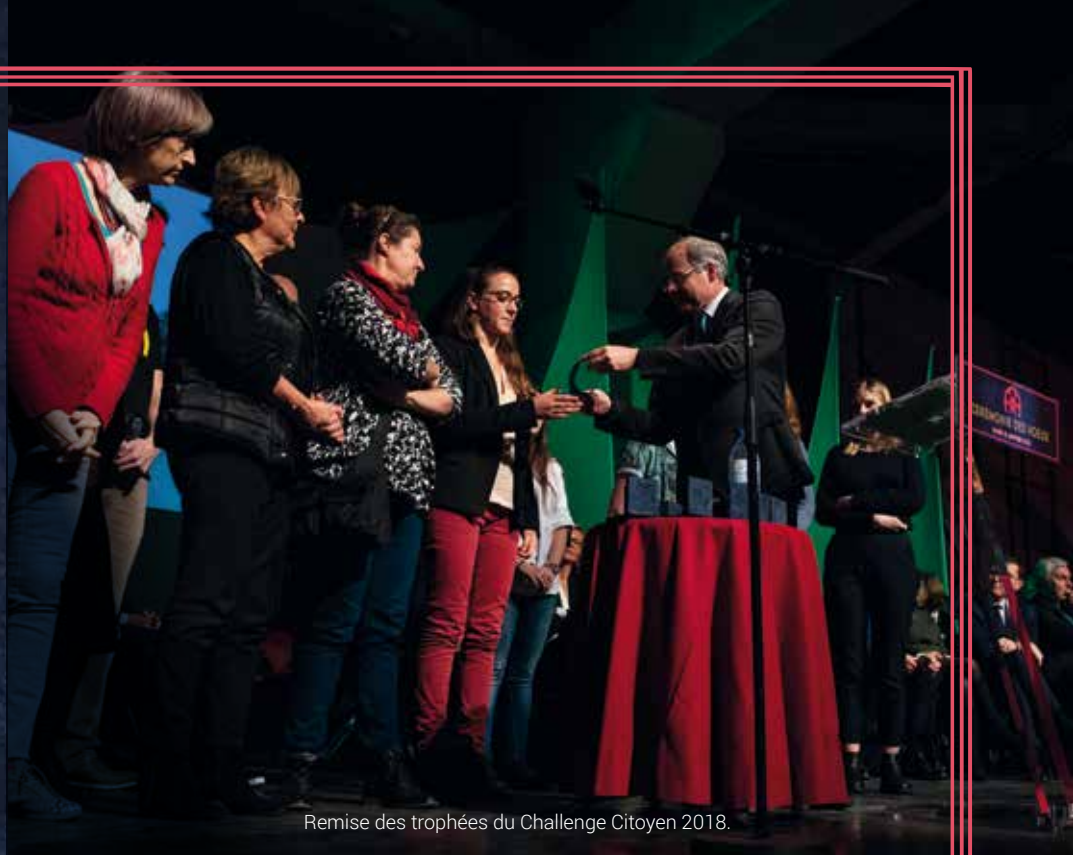
Remise des trophées du Challenge Citoyen 2018.