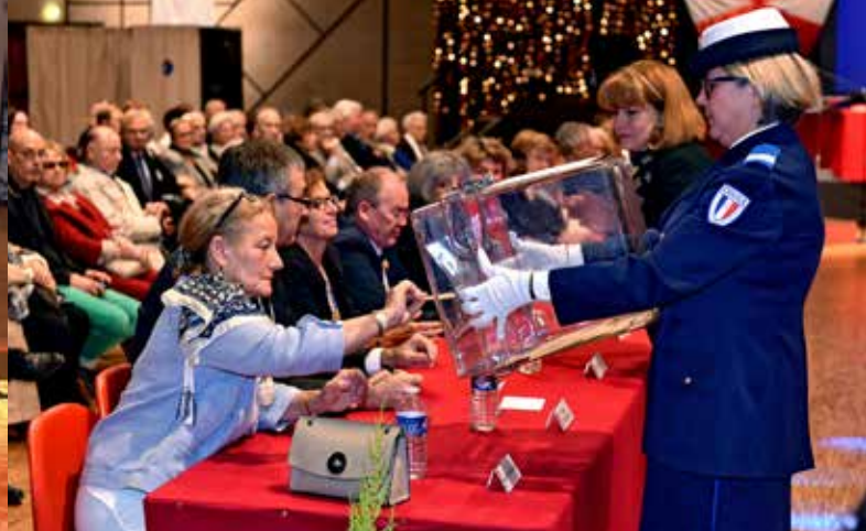
Le Conseil municipal vote pour élire le nouveau Maire