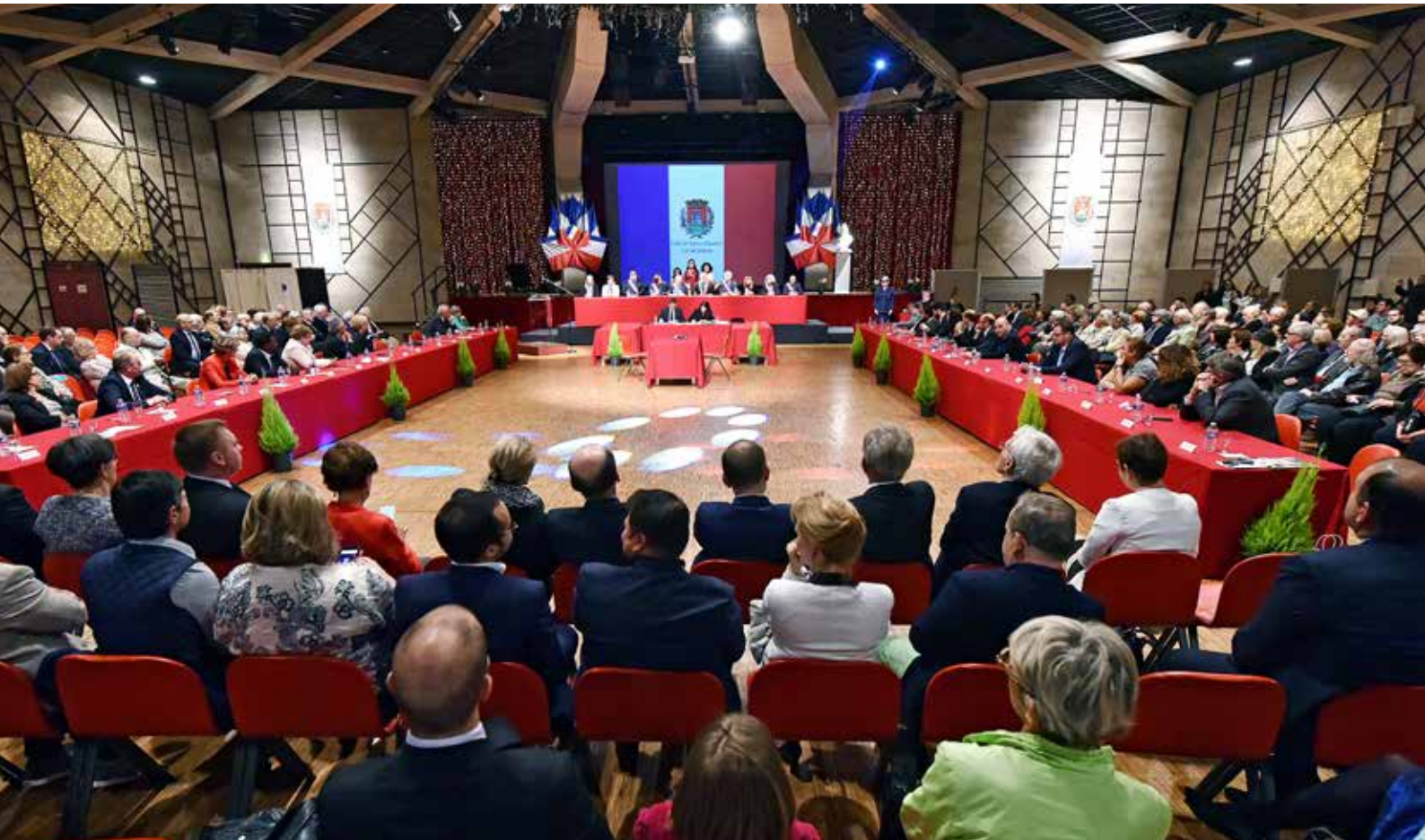
Les Mauritiens venus en nombre assister à l'élection