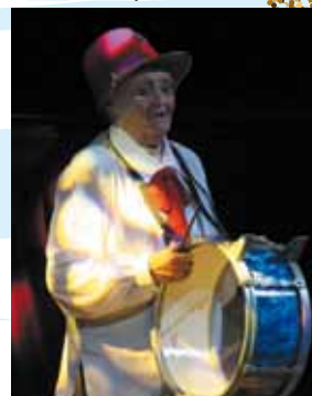
Spectacle du Club Diamant