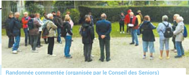
Randonnée commentée (organisée par le Conseil des Seniors)