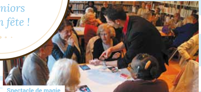
Spectacle de magie