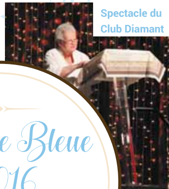
Spectacle du Club Diamant