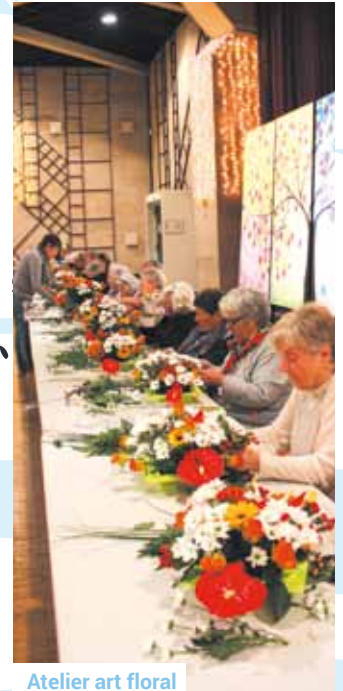
Atelier art floral