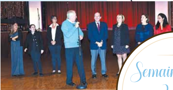
Déjeuner dansant et spectacle russe