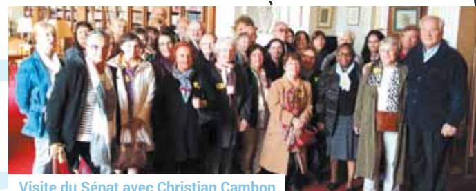
Visite du Sénat avec Christian Cambon