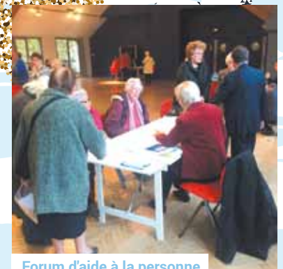
Forum d'aide à la personne